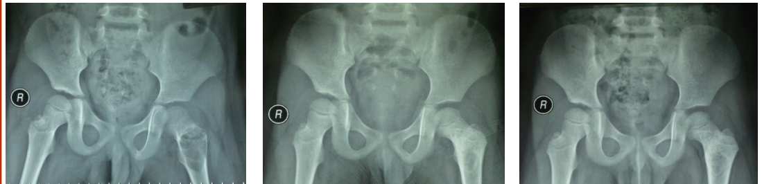
Foto X-ray Hip Pasien dengan SBC; kiri: sebelum tindakan, tengah: 6 bulan sesudah tindakan, kanan: 12 bulan sesudah tindakan

Luaran fungsional Kelompok PSI memiliki MSTS score yang lebih baik, khususnya pada bulan ke-3 (55%) dan bulan ke-6 (84%) daripada kelompok curettage dengan HA (47% dan 69.3%). Penyembuhan sempurna menunjukkan hasil yang sama pada evaluasi bulan ke-12, tetapi solid union didapatkan lebih cepat pada kelompok PSI. Kelompok PSI memiliki kecenderungan solid union dan luaran fungsional yang lebih cepat daripada kelompok curettage dengan HA. Kedua kelompok mencapai penyembuhan sempurna pada bulan ke-12 follow up.