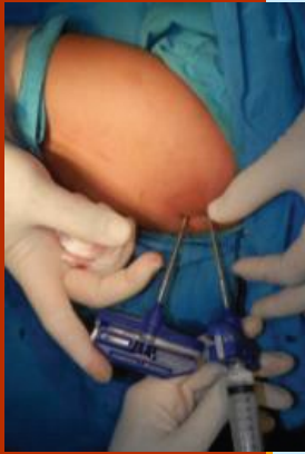
Percutaneous Steroid Injection (PSI)

Department of Orthopaedic and Traumatology, RSUPN Cipto Mangunkusumo / FMUI